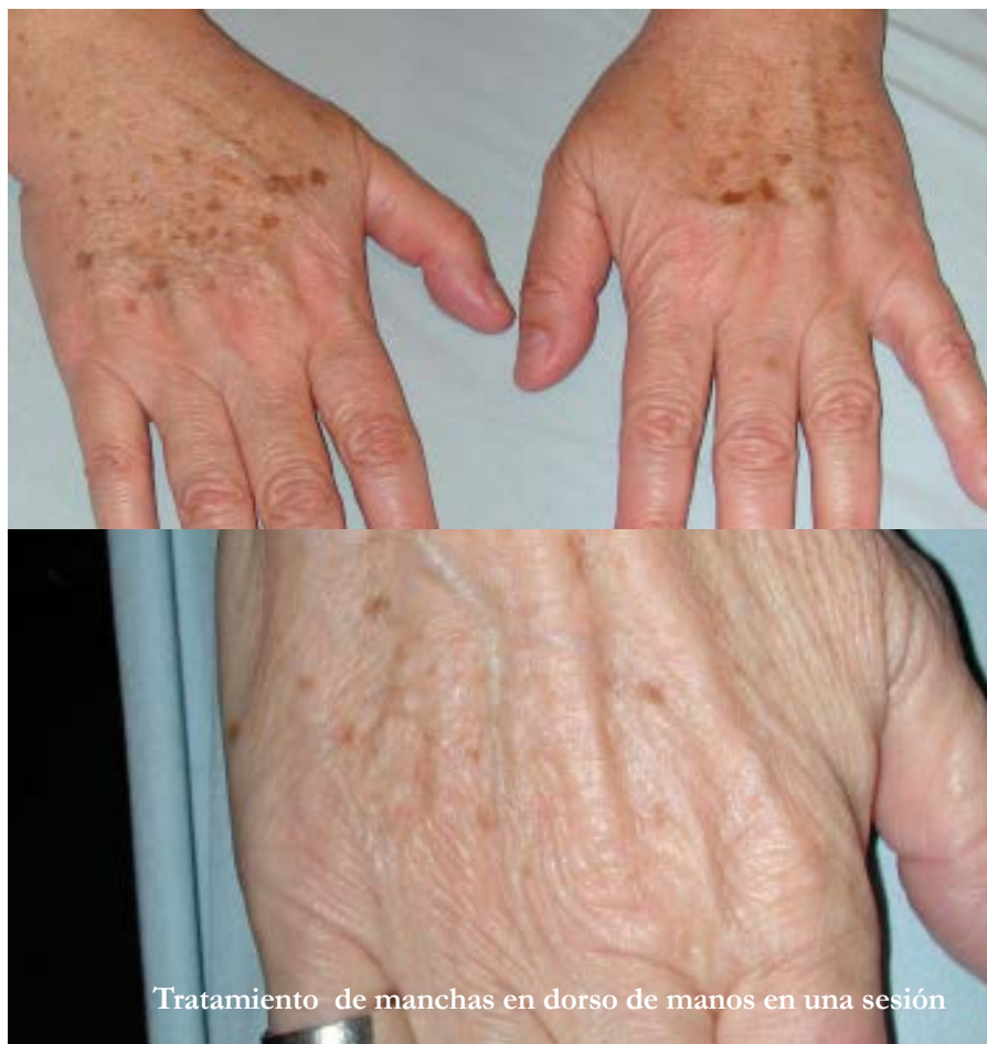
Tratamiento de manchas en dorso de manos en una sesión

La exposición no cuidada, prolongada a lo largo de los años hace que los rayos acumulados no sólo produzcan alteraciones en la piel sino también en la vista provocando cataratas, por lo que es indispensable el uso de anteojos antirrayo UV.