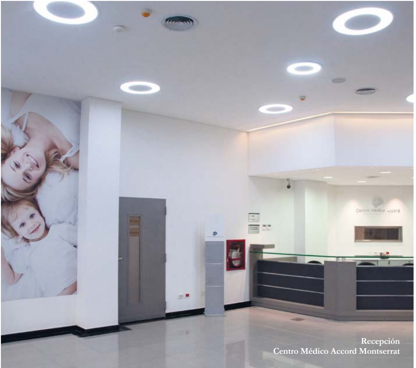
Recepción Centro Médico Accord Montserrat

uno y aportarán a nuestros afiliados una enorme capacidad de atención de la más alta calidad médica y tecnológica con las más rigurosas medidas de bioseguridad, todo eso sumado a profesionales de gran jerarquía.