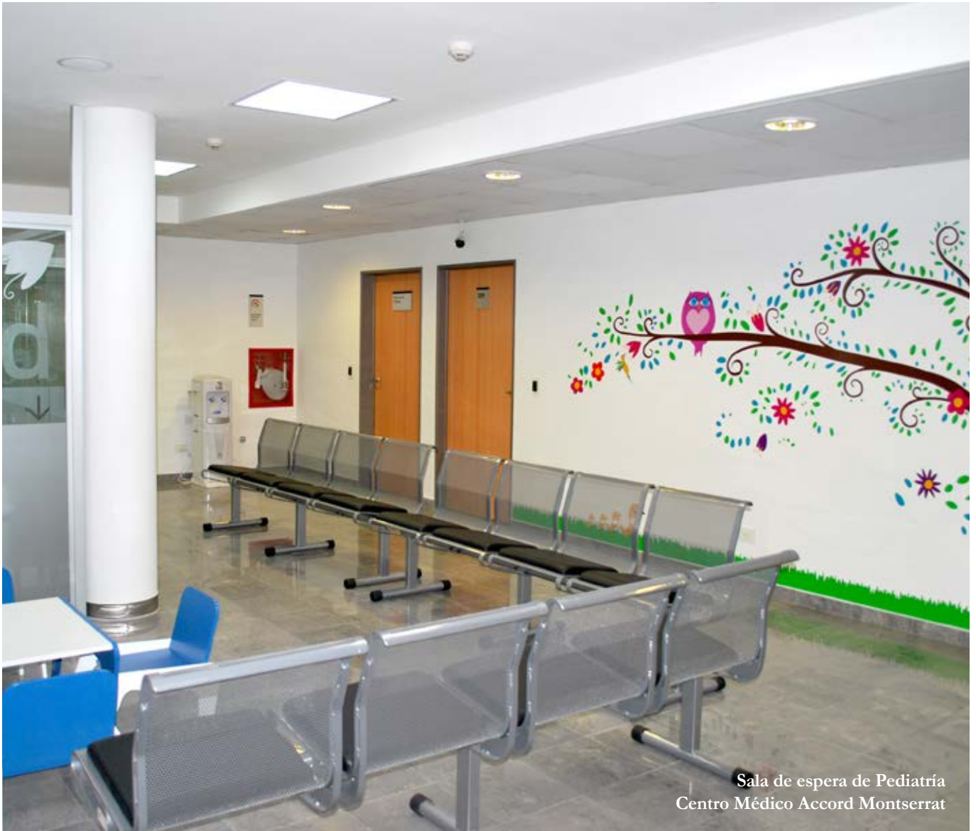
Sala de espera de Pediatría Centro Médico Accord Montserrat