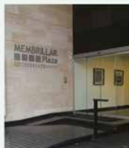
CEO Flores Membrillar 74 piso 3 of 305 C.A.B.A.