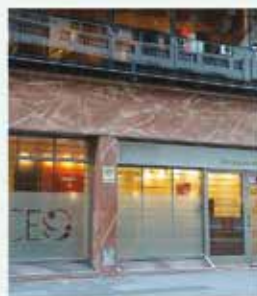
CEO Talcahuano 837 C.A.B.A.

En nuestras dos sedes los pacientes encuentran la atención de profesionales altamente capacitados para todas las especialidades odontológicas.