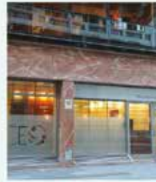
CEO Talcahuano 837 C.A.B.A.

En nuestras dos sedes los pacientes encuentran la atención de profesionales altamente capacitados para todas las especialidades odontológicas.