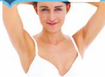
Charlas a la comunidad 2013 Patologías mamarias en general