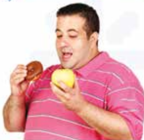
Charlas a la comunidad 2013 Obesidad, síndrome metabólico, dislipemia