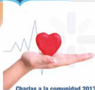
Charlas a la comunidad 2013 Ataque cardiaco, infarto de miocardio