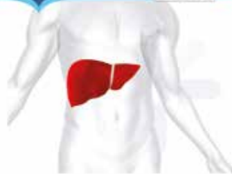
Charlas a la comunidad 2013 Enfermedades hepáticas más comunes: • hepatitis virales • inflamatorias • tóxicas •