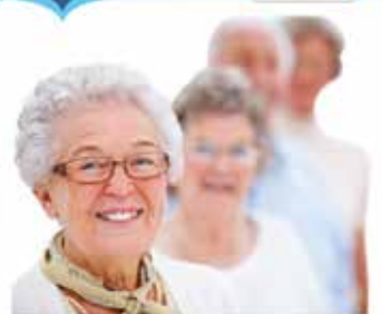
Charlas a la comunidad 2013 Demencias en general, demencia senil