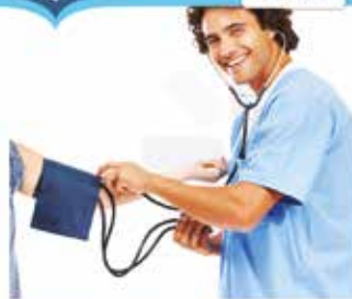
Charlas a la comunidad 2013 Medicina Preventiva