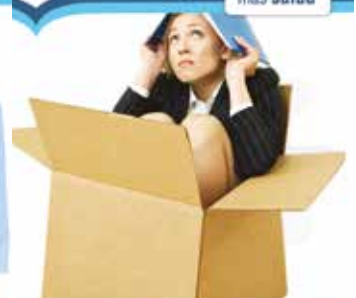
Depresión, Pánicos y Fobias