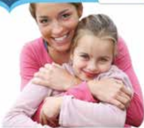
Charlas a la comunidad 2013 Gripe y virosis invernales